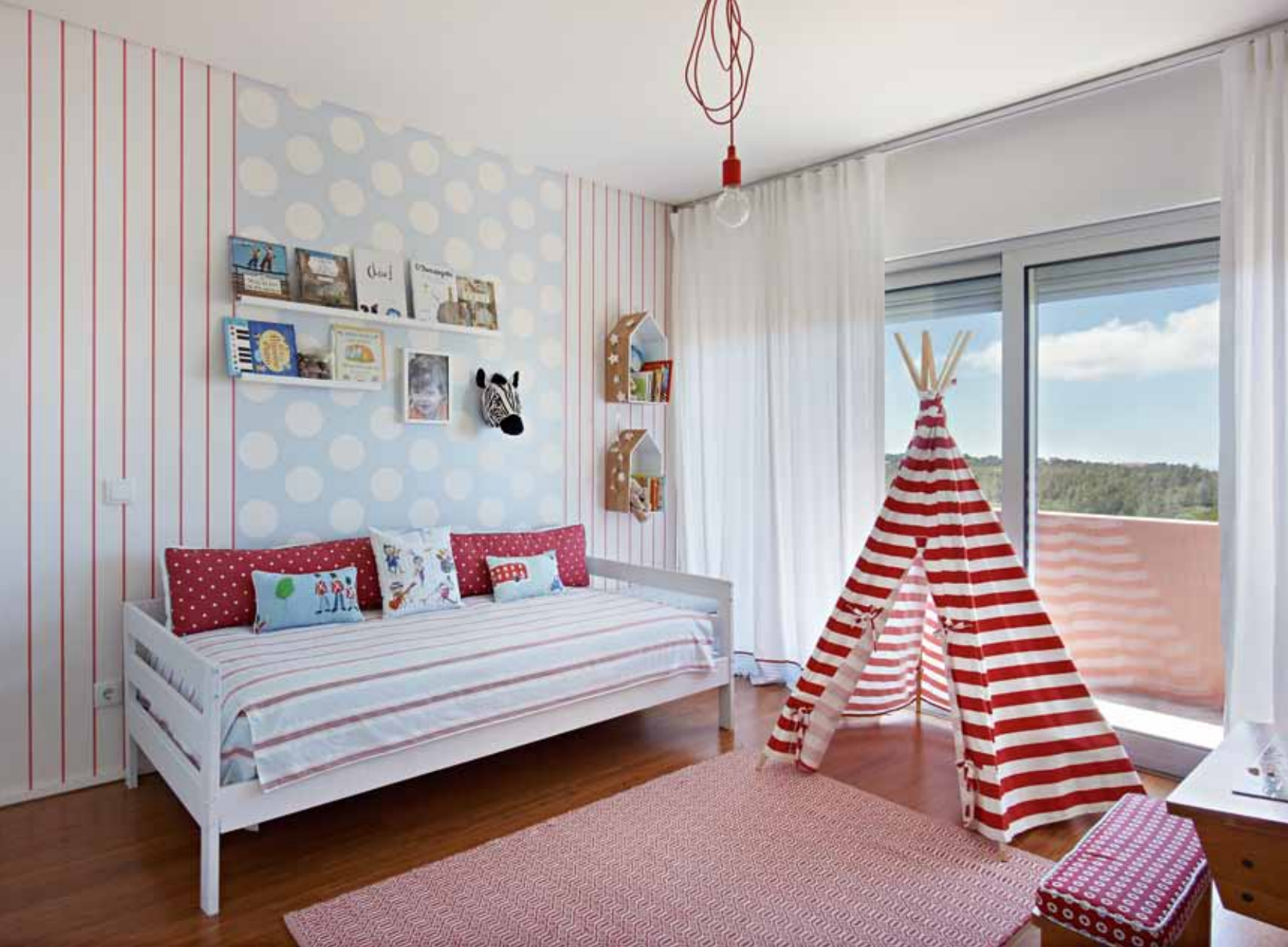
VERMELHO Na parede, papel da Pips, prateleiras da Ikea, e zebra da H&M Home. Tenda da Levada da Breca, tapete da Area e secretária antiga recuperada.