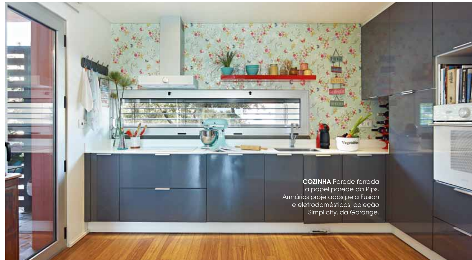
COZINHA Parede forrada a papel parede da Plips. Armários projetados pela Fusion e eletrodomésticos, coleção Simplicity, da Gorange.