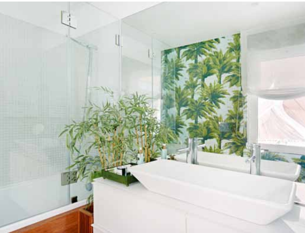
CASA DE BANHO Pastilha, papel de parede, da Pierre Frey, e bambu, da Tuka Bamboo, como revestimento. Lavatório Sanindusa.