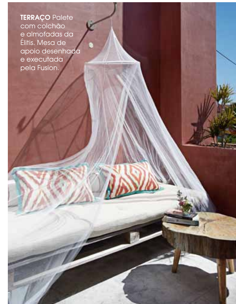
TERRAÇO Palete com colchão e almofadas da Élitis. Mesa de apoio desenhada e executada pela Fusion.