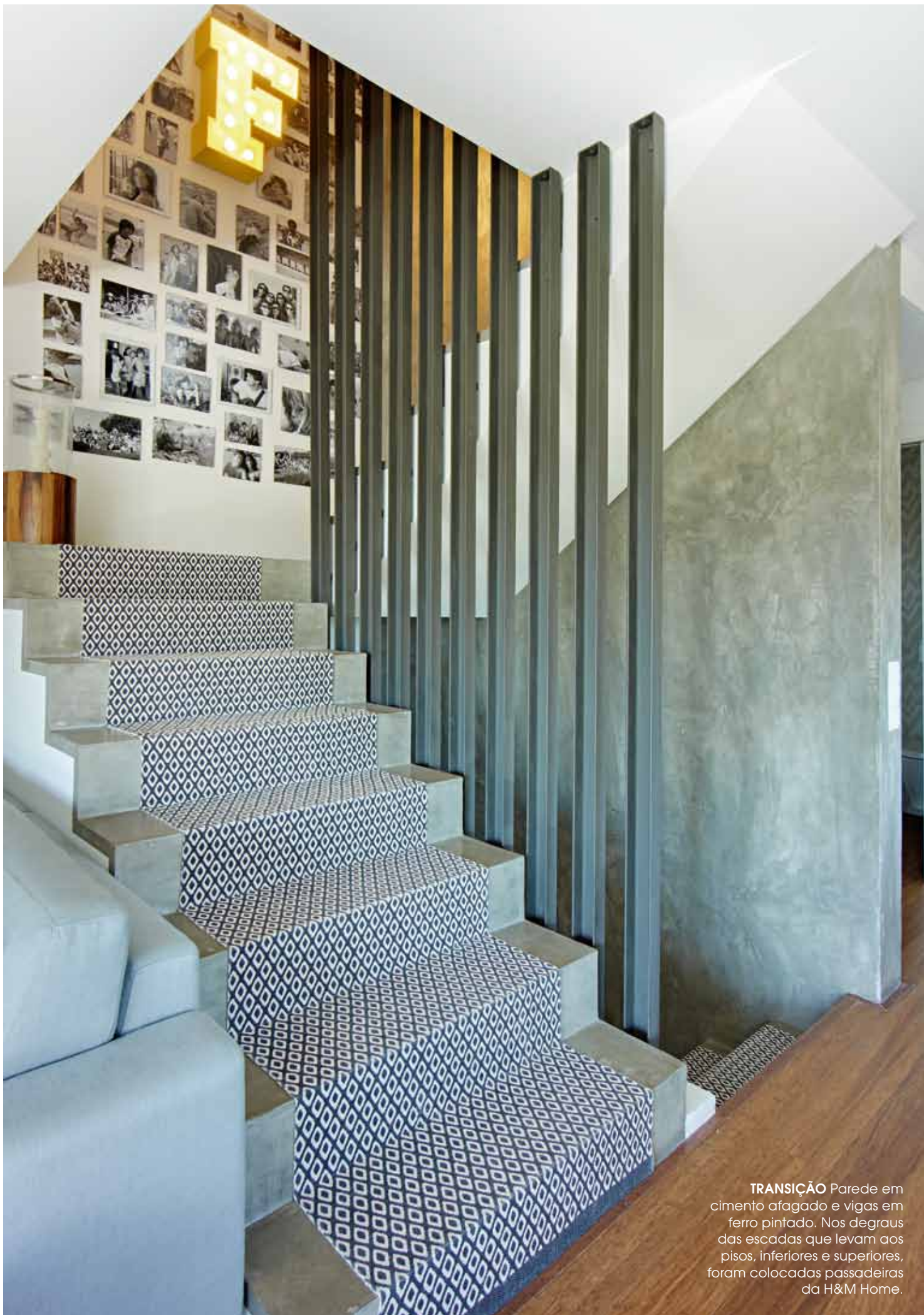
TRANSIÇÃO Parede em cimento afagado e vigas em ferro pintado. Nos degraus das escadas que levam aos pisos, inferiores e superiores, foram colocadas passadeiras da H&M Home.