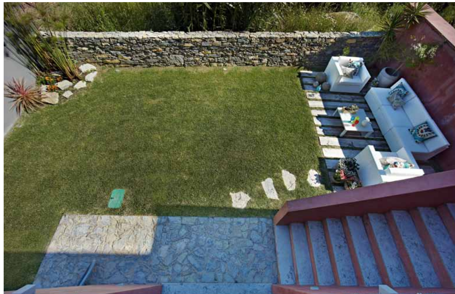
EXTERIOR Zona de estar, criada ao ar livre, no jardim da casa, com peças de mobiliário, disponíveis na Fusion.