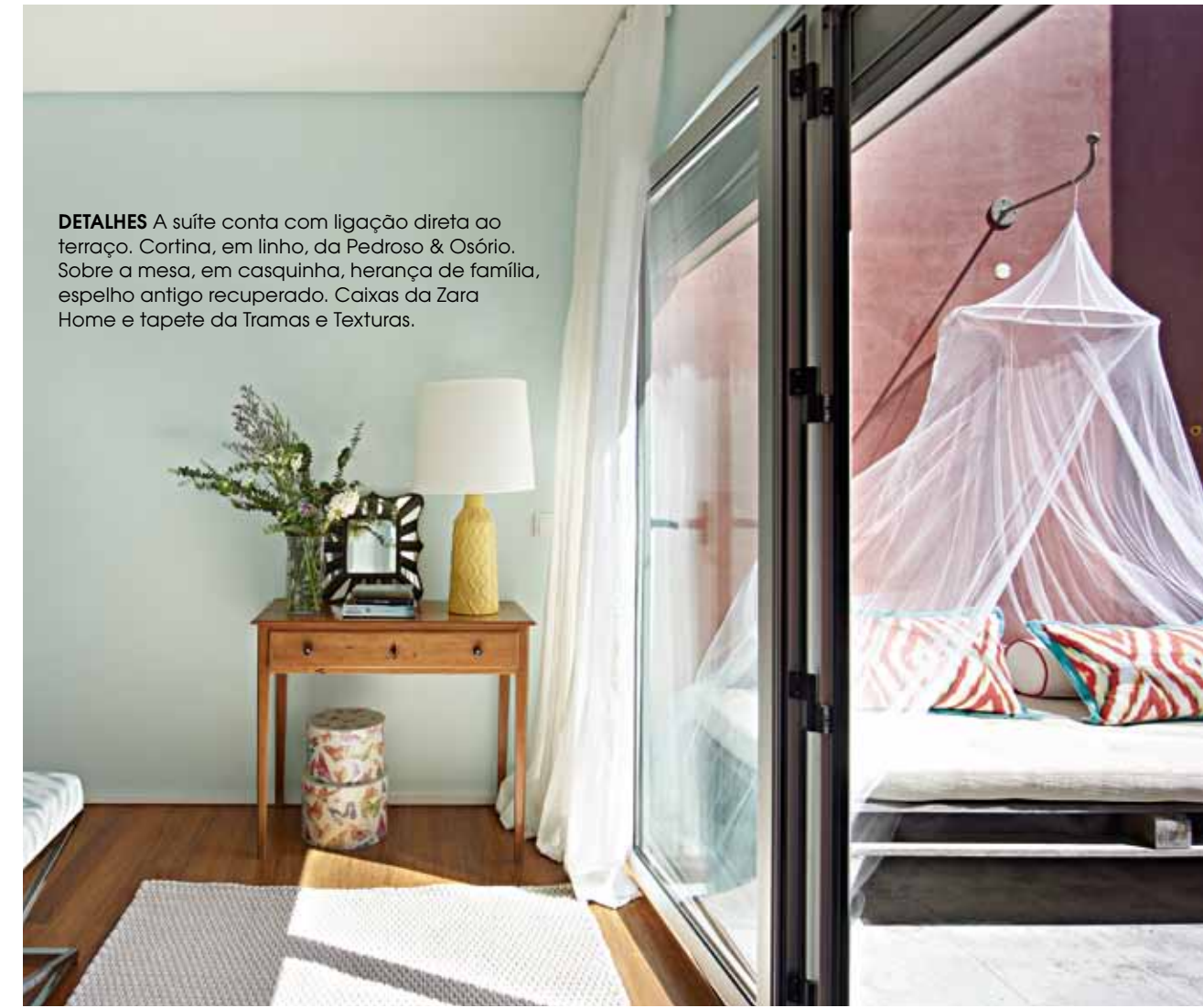
DETALHES A suíte conta com ligação direta ao terraço. Cortina, em linho, da Pedroso & Osório. Sobre a mesa, em casquinha, herança de família, espelho antigo recuperado. Caixas da Zara Home e tapete da Tramas e Texturas.