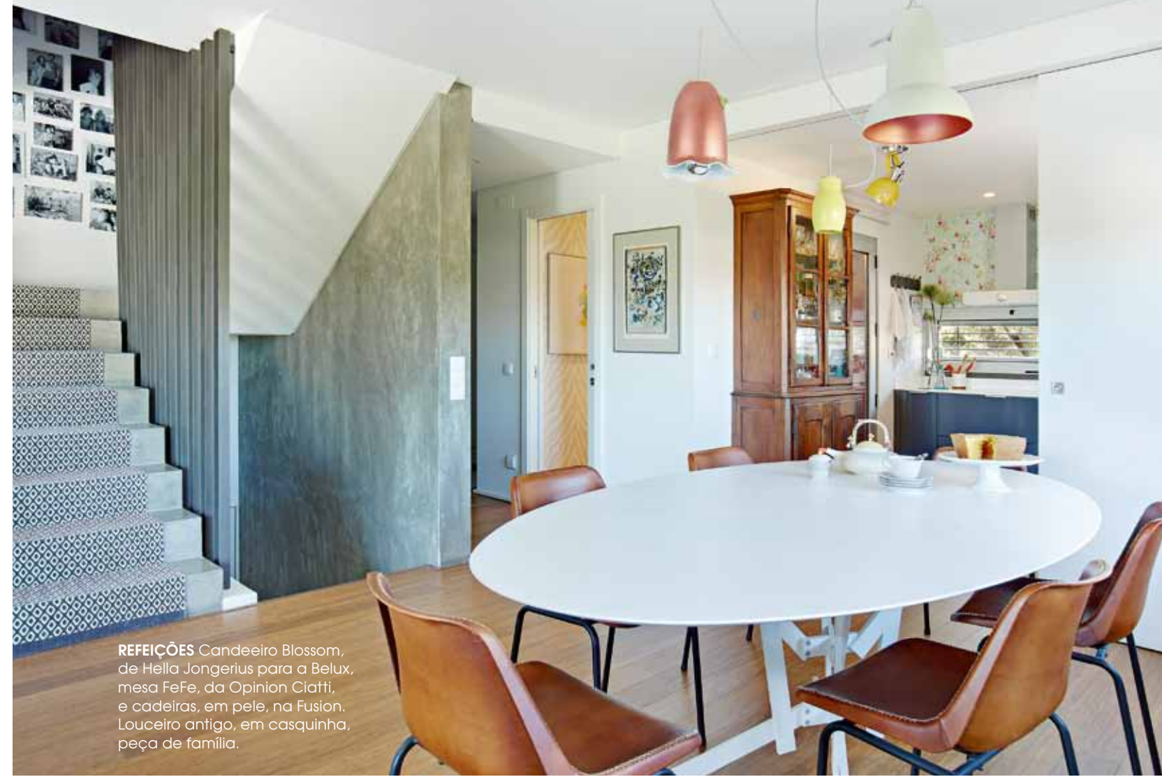
REFEIÇÕES Candeeiro Blossom, de Hella Jongerius para a Belux, mesa FeFe, da Opinion Ciatti, e cadeiras, em pele, na Fusion. Louceiro antigo, em casquinha, peça de família.